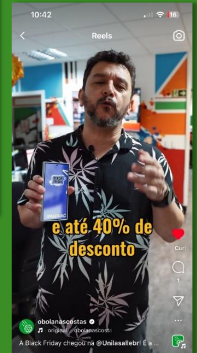
Post feed Conteúdo assinado