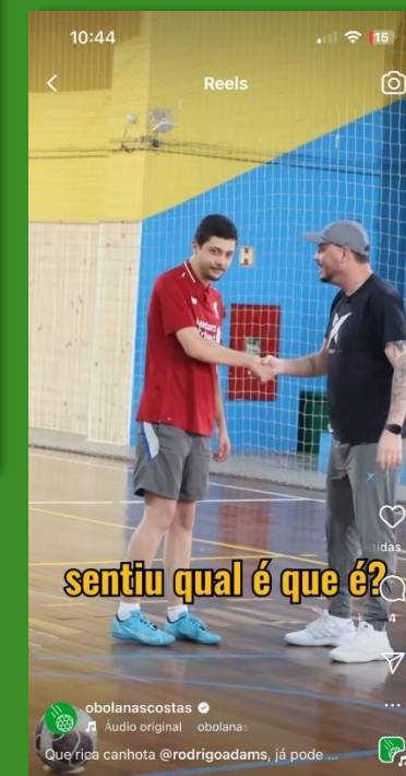
Post feed Conteúdo assinado